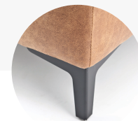
Metalen hoekpoot (chrom, zwart)